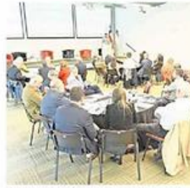
LOS PRINCIPALES DESAFÍOS REGIONALES FUERON ANALIZADOS.

Encuentro de Gremios por Chile convocó a unos 50 empresarios de la Región del Biobío, además de líderes locales de entidades productivas y de la CPC Biobío. Presidente de éste último organismo analizó el presente de nuestra región.