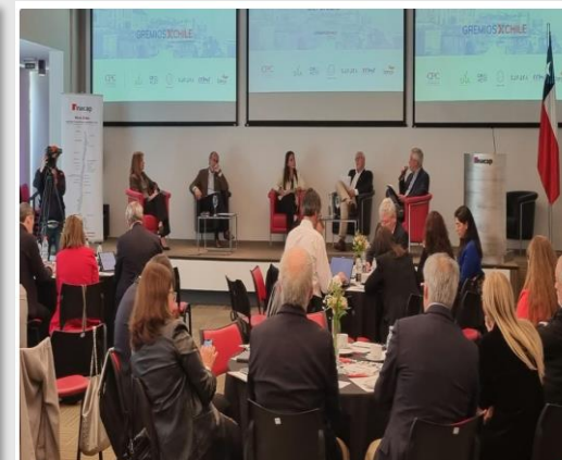
Fotografía: Reunión "Gremios por Chile" en Inacap.