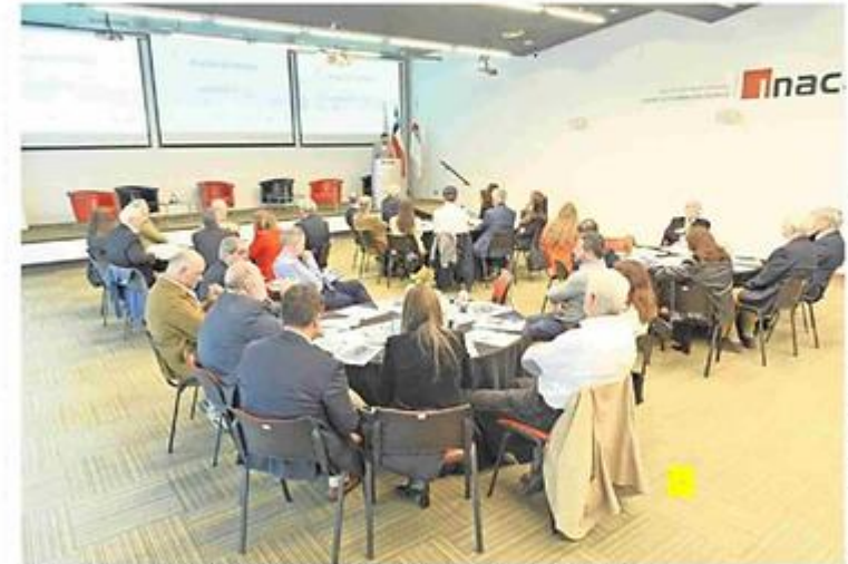
El encuentro se realizó ayer y convocó a diversos representantes y líderes de los diversos sectores productivos.

7 gremios de la Región fueron parte del encuentro encabezado por representantes de la CPC Nacional.