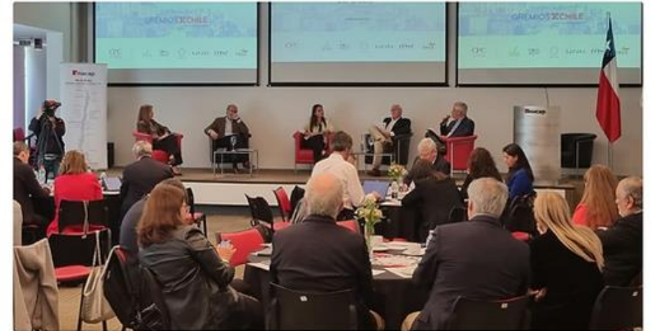
Fotografía: Reunión "Gremios por Chile" en Inacap.

también la creatividad de los empresarios y emprendedores locales. El trabajo en conjunto ayuda a lograr el éxito. La sólida base de este éxito se encuentra en una política económica regional que ha fomentado la diversificación y el fortale-