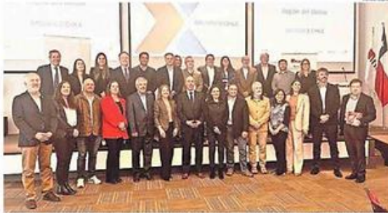
28 PARTICIPANTES DE LA ACTIVIDAD REALIZADA EN INACAP CONCEPCIÓN SAUCALIANO ENALABORARON SOBRE EL FUTURO DE LA REGIÓN.

Cerca de 50 empresarios del Biobío, además de los líderes gremiales loca-