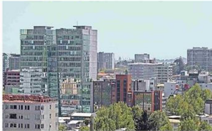
El encuentro se llevará a cabo este viernes en Concepción.